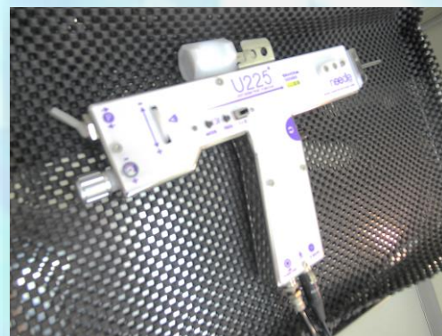
新潟初U225メソインジェクター